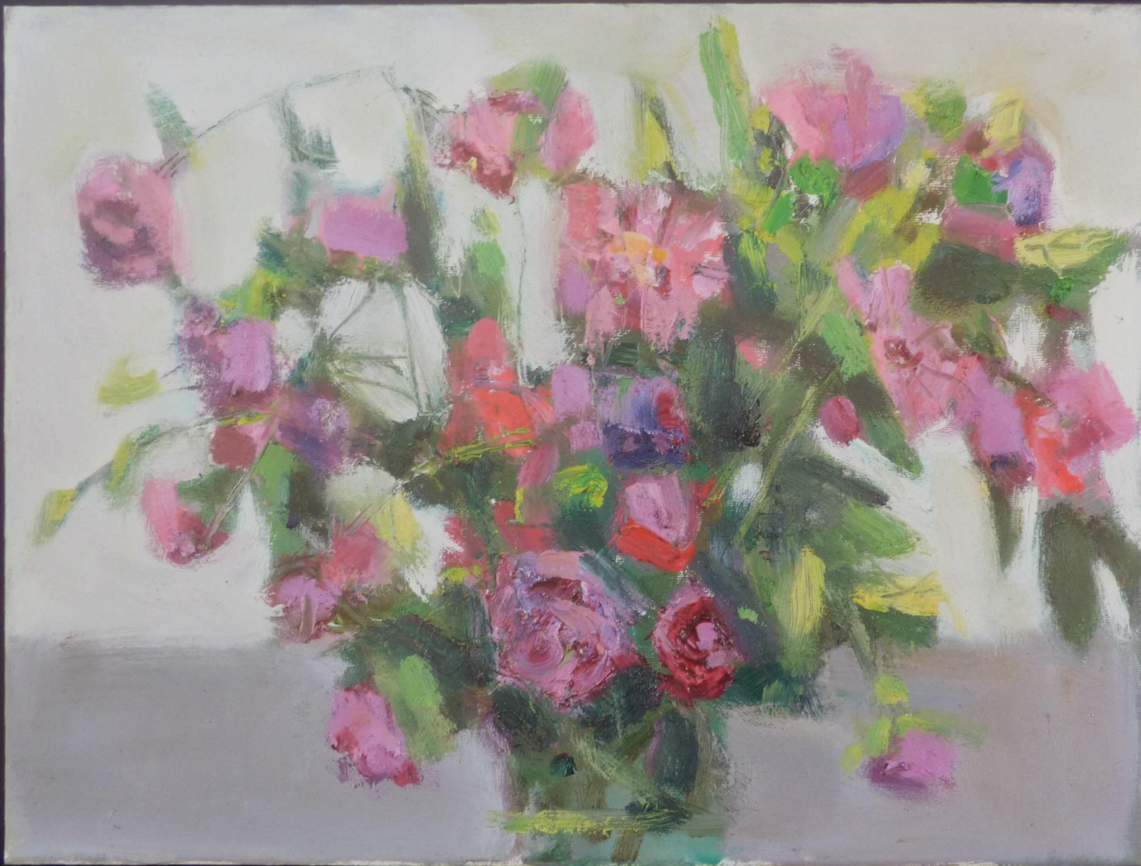
Rosen (2012), Öl auf Leinwand, 30 x 40 cm