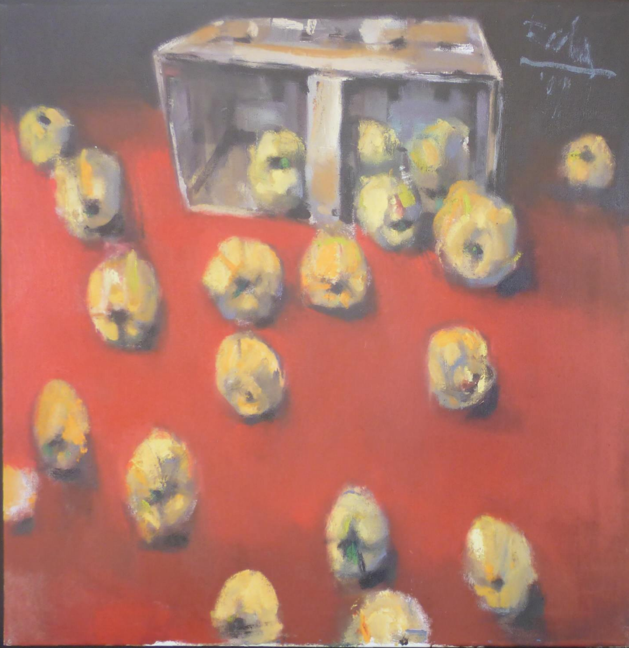
Quitten auf rotem Grund (2009), Öl auf Leinwand, 80 x 80 cm