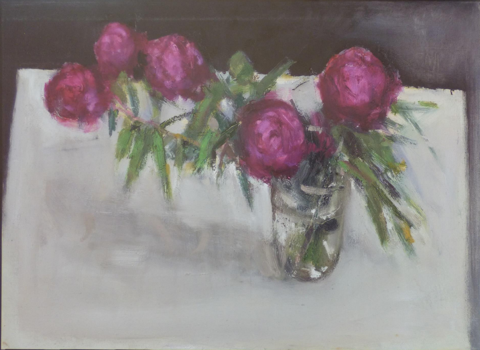
Pfingstrosen (2011), Öl auf Leinwand, 57 x 77 cm