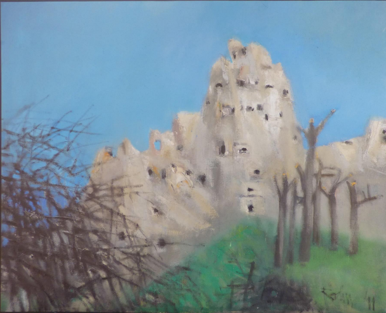
Kapadokien II (2011), Öl auf Leinwand, 80 x 100 cm