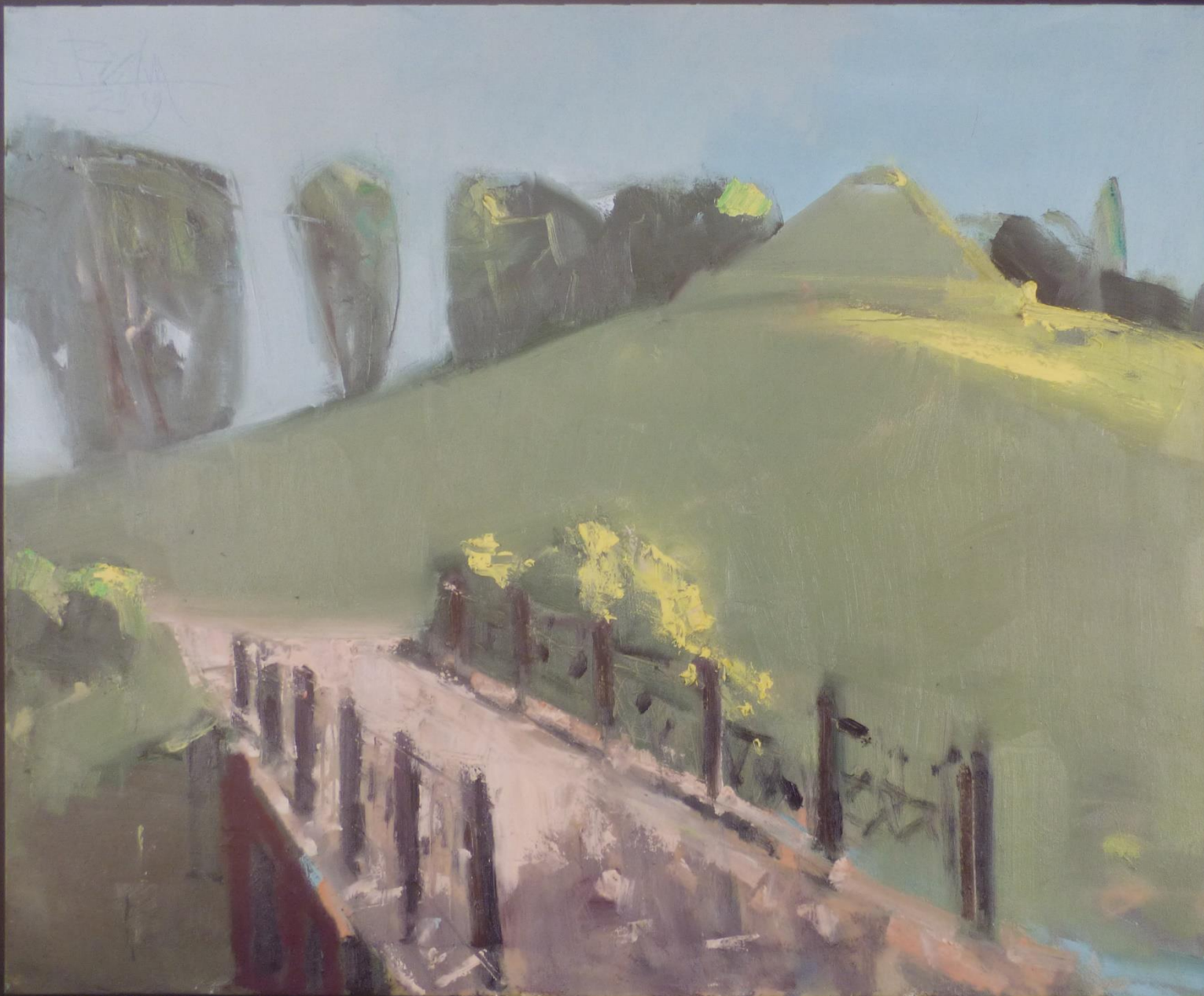
Branitz (2009), Öl auf Leinwand, 80 x 100 cm