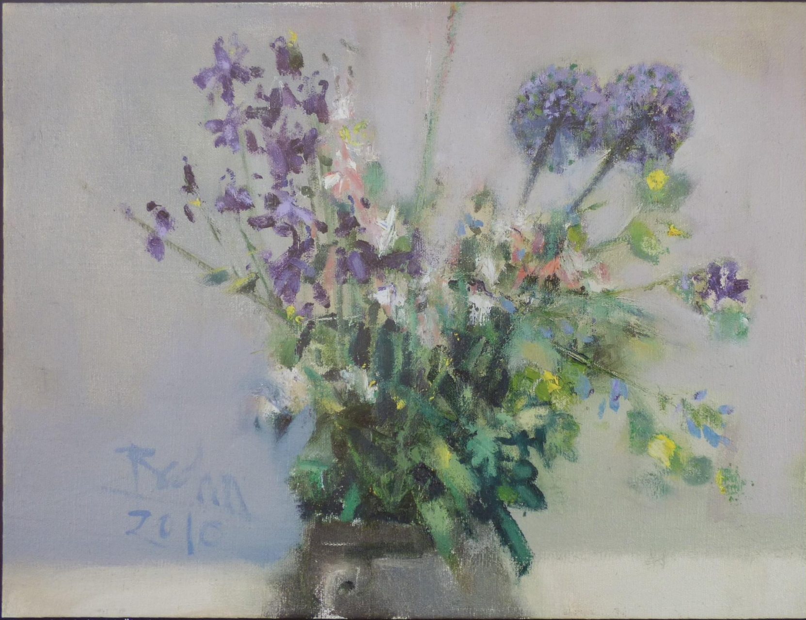
Allium und Akelei (2010), Öl auf Leinwand, 60 x 80 cm