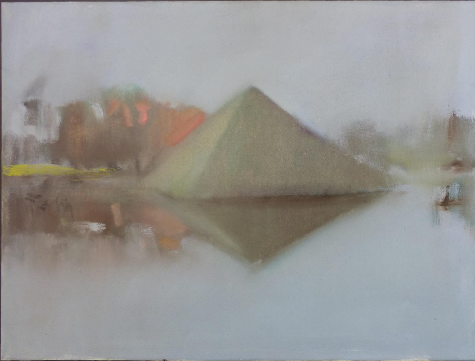
Pyramide im Branitzer Park (ohne Jahr), Öl auf Leinwand, 60 x 80 cm