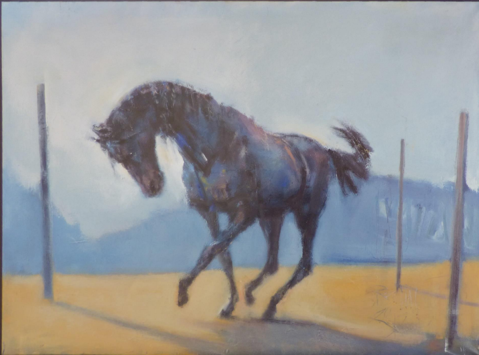
Schwarzes Pferd (2013), Öl auf Leinwand, 80 x 110 cm