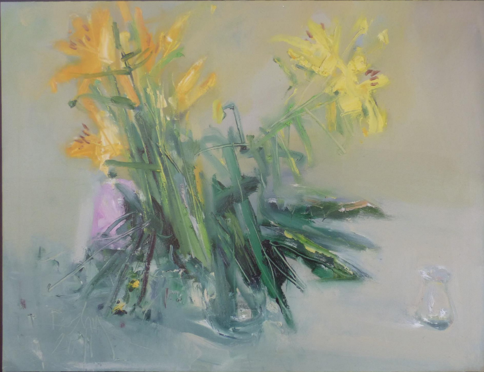
Lilienstrauß (2011), Öl auf Leinwand, 60 x 80 cm