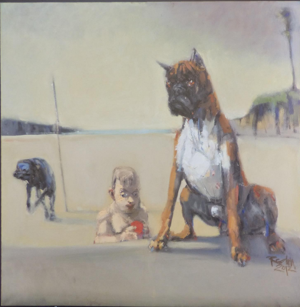
Boxer mit Kind (2012), Öl auf Leinwand, 100 x 100 cm